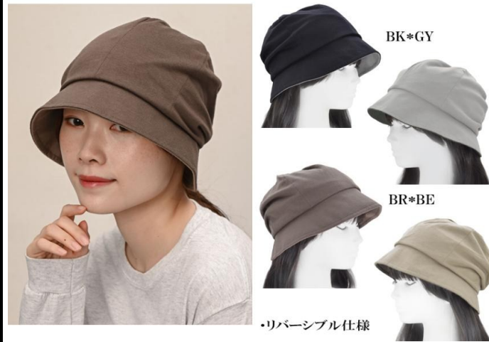
・リバーシブル仕様